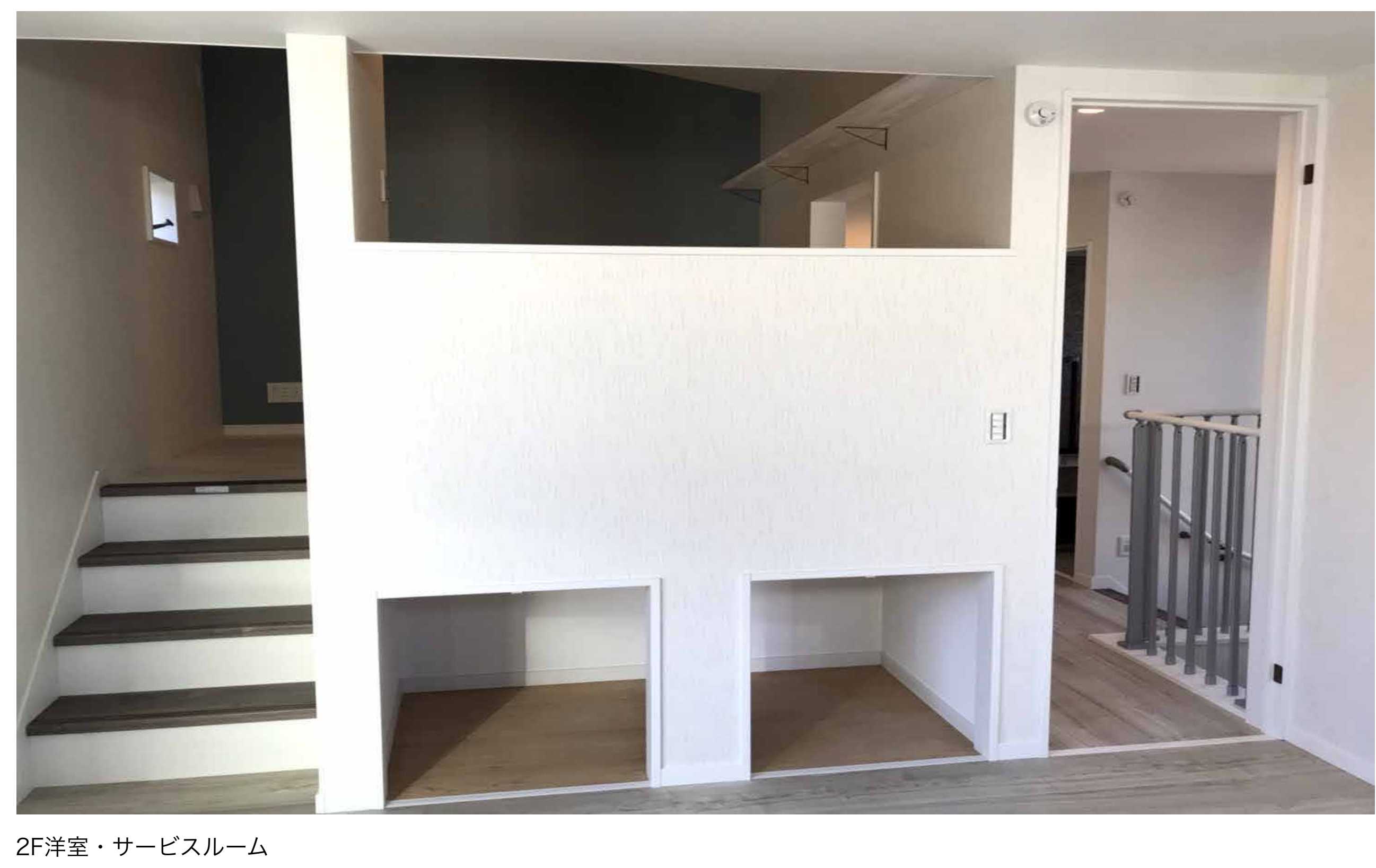
2F洋室・サービスルーム